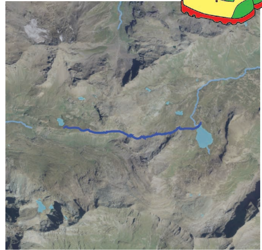
Sviluppo planimetrico (m)